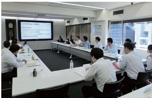
全国社員連絡会(経営者へのプレゼン)